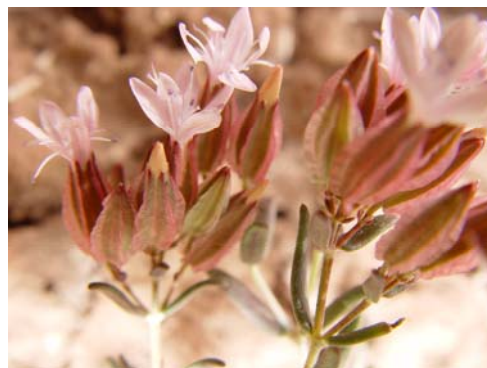
شکل ۱- روشن‌بال خراسانی در رویشگاه چلبو عطانیه

گیاه روشن‌بال خراسانی با نام علمی D. khorasanica Rech. f. در پایه چند ساقه‌ای با برگهای خطی یا مستطیلی - خطی در پایین باریک بدون دمبرگ، قطعات گرز (۱)، ۳ تا ۷ گل، کاسه در پایین لوله‌ای و دارای ۵ بال با عرض ۱ تا ۱/۵ میلی متر، گلبرگ باریک واژ تخم مرغی، بلندتر از کاسه با رنگهای متنوع، تخمدان کروی بیضوی و دانه آن کلیوی - کروی شکل و دارای غدد ریز می‌باشد (شکل ۱).