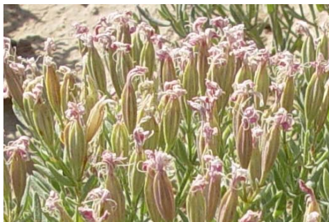
شکل ۲- روشن‌بال آلمه‌ای در رویشگاه دشت میرزابایلو

خراسانی به جهت دارا بودن بالهای روشن در کاسبرگ و گونه روشن‌بال آلمه‌ای بعلت داشتن گلبرگ نازک و کشیده و داشتن شاخه‌های متقابل در قاعده با گونه‌های خارج از ایران تفاوت دارند (۱۶).