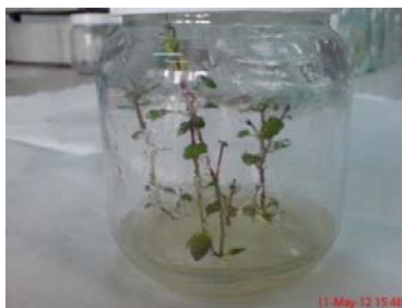
شکل ۱- گیاهچه‌های درون‌شیشه‌ای برای تهیه ریزنمونه

استفاده شد. بعد از اتمام فرایند اتوکلاو، محیط‌های کشت تا زمان شروع کشت (پس از یک هفته) در شرایط تاریکی نگاه‌داری شدند. به منظور ریزغده‌زایی، شیشه‌های حاوی ریزنمونه‌های کشت شده به داخل دستگاه ژرمیناتور (تاریکی مطلق با دمای 17 \pm 2 درجه سانتی‌گراد) منتقل شدند و به مدت ۴ ماه نگاه‌داری شدند. طی ماه اول کشت سرعت ریزغده‌زایی توسط فرمول \frac{(n_1 \times t_1) + \dots + (n_n \times t_n)}{t_n} بدست آمد که n تعداد ریزغده‌های آغازش یافته و t زمان (روز) می‌باشد. برای اندازه‌گیری این صفت هفته‌ای یکبار به مدت یک ماه تعداد ریزغده‌های آغازش یافته شمارش و یادداشت‌برداری شد. پس از آن طی ۳ ماه و به صورت ماهانه صفاتی مانند درصد ریزغده‌زایی، طول، عرض و تعداد ریزغده، درصد ریزغده‌های فاقد رکود و وزن ریزغده اندازه‌گیری شد. البته لازم به ذکر است که صفاتی همانند طول و عرض و وزن ریزغده‌ها در زمان تخریب محیط‌های کشت (پایان ماه چهارم) اندازه‌گیری شد. برای اندازه‌گیری درصد ریزغده‌زایی و درصد ریزغده‌های فاقد رکود به ترتیب تعداد ریزغده نسبت به تعداد ریزنمونه زنده و تعداد ریزغده‌های فاقد رکود نسبت به کل ریزنمونه موجود در یک واحد آزمایشی (شیشه مرباخوری) شمارش شدند. تجزیه و تحلیل داده‌ها با استفاده از نرم‌افزار SPSS ver.16 و مقایسه میانگین تیمارها توسط آزمون چند دامنه‌ای دانکن در سطح احتمال ۵ درصد انجام و نمودارها با استفاده از نرم‌افزار Excel ترسیم شد.