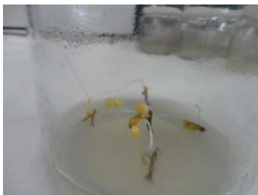
شکل ۳- ریزغده تولید شده در غلظت ۲ میلی‌گرم در لیتر کیتین

که درصد ریزغده‌زایی تنها در ماه سوم و چهارم به طور معنی‌داری تحت تأثیر غلظت‌های مختلف کیتین قرار گرفته است. اثر غلظت‌های مختلف پوتریسین و همچنین اثر متقابل پوتریسین با کیتین در هر سه ماه نیز غیرمعنی‌دار شد (جدول ۱). مقایسه میانگین داده‌ها نشان داد که غلظت ۲ میلی‌گرم در لیتر کیتین بیشترین درصد ریزغده‌زایی را ایجاد کرده است (جدول ۲ و شکل ۲ و ۳). برخلاف نتایج بدست آمده در این تحقیق، گزارش کردند که در محیط کشت Ms دارای پلی‌آمین‌ها (spm و spd، put) ۱۰۰ درصد ریزغده‌زایی پس از ۴۰ روز حاصل شد (۹). همچنین گزارش شده که وجود پلی‌آمین‌های آزاد در ریزنمونه‌ها،