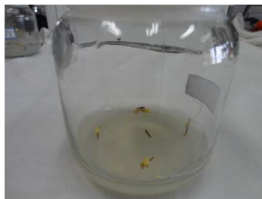
شکل ۲- ریزغده تولید شده در غلظت ۱ میلی‌گرم در لیتر کیتین