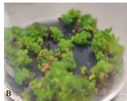
شکل ۱- القای PLB از ریزنمونه‌های پروتوکورم بعد از ۶۰ روز از کشت درون‌شیشه‌ای Phalaenopsis pulcherrima روی محیط کشت MS

شامل عصاره آنزیمی، بافر فسفات پتاسیم ۵۰ میلی‌مولار (pH 7.0) و پراکسید هیدروژن ۱۵ میلی‌مولار بود (۱). فعالیت آنزیم سوپراکسید دیسموتاز با قرائت جذب محلول واکنش شامل عصاره آنزیمی، متیونین ۱۳ میلی‌مولار، ریوفلاوین ۱۳ میکرومولار و نیتروبلوتترازولیوم ۶۳ میکرومولار در طول موج ۵۶۰ نانومتر محاسبه گردید (۲). فعالیت آنزیم پراکسیداز براساس میزان اکسیداسیون دیانیزیدین اکسید شده (3,3'-dianisidine dimethoxybenzidine) در طول موج ۴۶۰ نانومتر انجام شد. محلول واکنش شامل ۲۰ میلی‌مولار بافر فسفات (pH 5.0)، ۳ میلی‌مولار H_2O_2 ، یک میلی‌مولار دیانیزیدین و ۵۰ میکرولیتر عصاره آنزیمی بود. پس از تهیه کوکتل آنزیمی، واکنش با افزودن H_2O_2 شروع می‌شود و جذب دیانیزیدین اکسید شده در طول موج ۴۶۰ نانومتر اندازه‌گیری شد (۲۸).