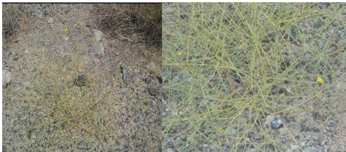
شکل ۲- گیاه کک‌کش بیابانی ( Pulicaria gnaphalodes ) در مرحله گلدهی

تعداد گل در بوته ۸۱ عدد، وزن تر و خشک اندام هوایی به ترتیب ۰/۰۷ و ۰/۰۳ گرم و وزن هزاردانه ۰/۱۵ گرم بود.