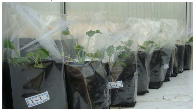
شکل ۴- سازگاری گیاهان ریشه دار شده در شرایط گلخانه