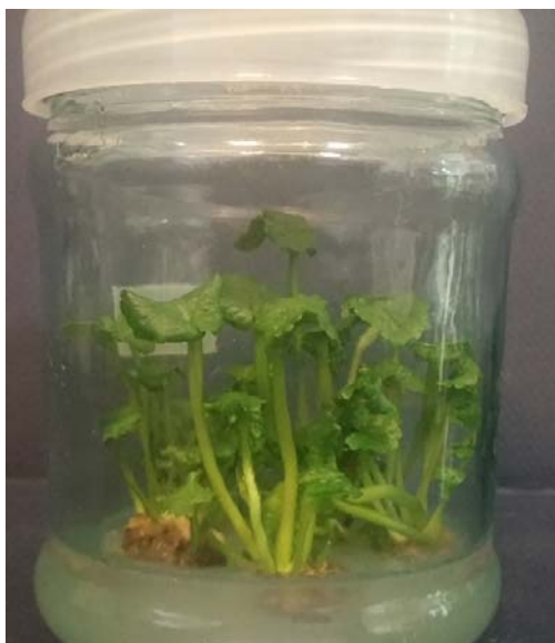
شکل ۲- محیط برتر تکثیر، تیمار P6 ( 0.5 \text{ mgL}^{-1} BA و 0.1 \text{ mgL}^{-1} NAA) و 0.5 \text{ mgL}^{-1} 2ip

انعطالف پذیری ریشه ها تراکم ریشه ها و همچنین شادابی گیاهان سازگار شده در گلدان، تیمار R1 حاوی ۰/۵ میلی گرم بر لیتر IBA به عنوان برترین محیط ریشه‌زایی انتخاب گردید (جدول ۶).