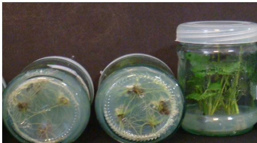
شکل ۳- محیط برتر ریشه‌زایی، تیمار RI حاوی ۰/۵ میلی‌گرم بر لیتر IBA