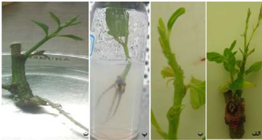
شکل ۲- مراحل ریشه‌زایی شاخساره کنار بنگالی رقم بی هسته درشت، الف) شاخساره پرآوری شده، ب) تقسیم شاخساره، پ) ریشه دار شدن پس از گذشت ۴ هفته و ت) آماده‌سازی جهت کشت در گلدان.

میانگین‌های با حروف مشترک از لحاظ آماری و براساس آزمون چند دامنه ای دانکن در سطح احتمال ۵ درصد با یکدیگر دارای تفاوت معنی دار نیستند.