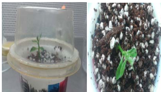
شکل ۳- گیاهک منتقل شده به محیط سازگاری پس از گذشت سه هفته.

سازگاری: همه گیاهان ریشه‌دار شده پس از انتقال به محیط سازگاری حاوی پرلایت و کوکوپیت به میزان برابر، پس از گذشت سه هفته سازگاری خوبی با محیط نشان داده و گیاهان شروع به رشد نمودند.