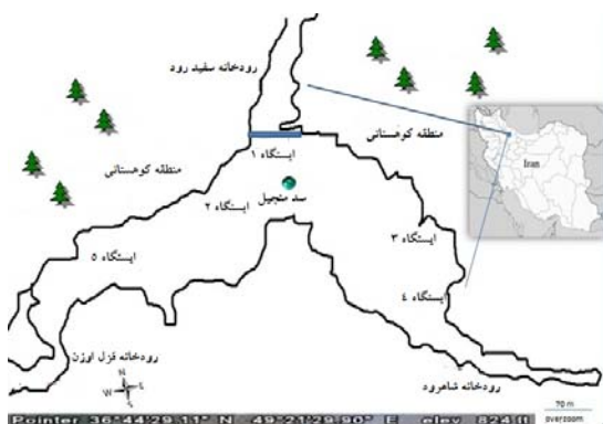
شکل ۱- نقشه ۵ ایستگاه نمونه برداری در سد منجیل

سد منجیل واقع در شمال ایران و استان گیلان بوده که ارتفاع آن از سطح دریا ۳۵۰ متر، مساحت تقریبی آن ۵۶ کیلومتر مربع و حداکثر عمق آن ۵۰ متر است. دو رودخانه شاهرود از سمت شرق و قزل اوزن از سمت غرب همچنین باران‌های فصلی از منابع اصلی تامین کننده آب سد هستند. مخزن سد جهت تامین آب مورد نیاز کشاورزی و مهار آبهای جاری استان گیلان در سال ۱۹۶۱ ساخته شده است (شکل ۱).