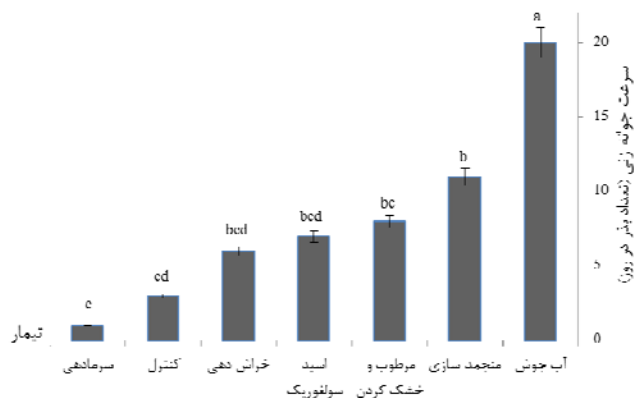
شکل ۳- مقایسه سرعت جوانه‌زنی بذر تاج خروس زیتنی ( A. cruentus ) در تیمارهای مختلف

نتایج حاصل از مقایسات گروهی (روش دانکن) در سرعت جوانه زنی بذرهای به صورت نمودار شماره ۳ در زیر آورده شده است. بالاترین سرعت جوانه‌زنی بذرهای در تیمار آب جوش (۲۰ بذر در روز) و در کمترین سرعت جوانه‌زنی بذرهای در تیمار سرمادهی اتفاق افتاد.