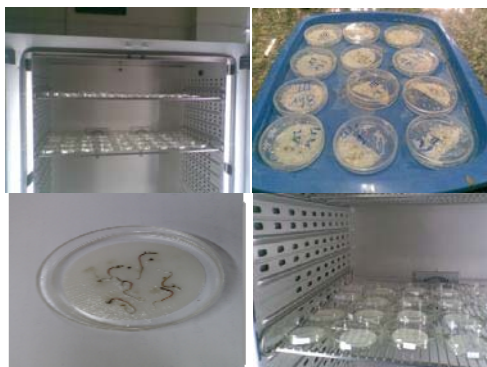
شکل ۱- مراحل انجام آزمایش و نمونه بذره‌های جوانه زده