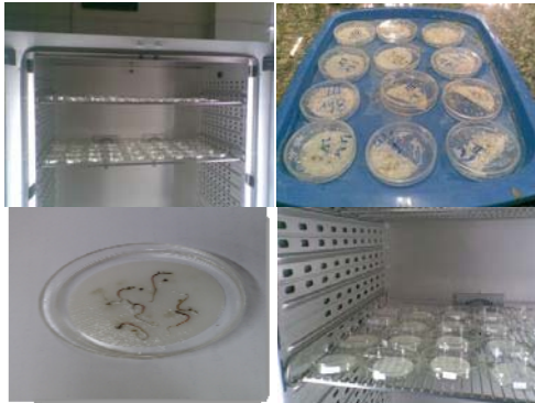
شکل ۱- مراحل انجام آزمایش و نمونه بذره‌های جوانه زده