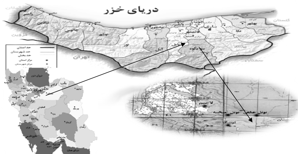
شکل ۱- موقعیت منطقه مورد مطالعه

آوری شدند (۸). لاشبرگ‌های جمع‌آوری شده در داخل کیسه‌های پلاستیکی قرار داده شده و به آزمایشگاه منتقل شدند. نمونه‌ها بعد از انتقال به آزمایشگاه به مدت ۲۴ ساعت در فضای آزمایشگاه خشک شدند. سپس براساس نوع لاشبرگ از همدیگر تفکیک شدند. در این مطالعه از تکنیک کیسه‌لاشبرگ استفاده شد. این تکنیک یک روش معمول در انکوباسیون لاشبرگ در عرصه یا آزمایشگاه است که در آن لاشبرگ به میزان لازم در کیسه لاشبرگ با ابعاد مشخص قرار داده شده و برای مطالعات تجزیه لاشبرگ در طول مدت زمان مطالعه در آزمایشگاه یا عرصه نصب می‌شود. ابعاد کیسه لاشبرگ‌های بکار برده شده در این تکنیک 30 \times 20 سانتی‌متر با روزنه دو میلی‌متر از جنس نایلون و با توجه به اهداف مطالعه به دو صورت دولایه (یک جیبه) برای مطالعات مربوط به لاشبرگ‌های انفرادی و سه‌لایه (دوجیبه) برای مطالعات لاشبرگ‌های ترکیبی بود (۸). در هر کیسه‌لاشبرگ در حدود ۱۰ گرم نمونه لاشبرگ خشک شده در فضای آزمایشگاه قرار داده شد. قبل از نصب کیسه‌ها برچسبی شامل نام گونه و وزن اولیه لاشبرگ تهیه شده و در داخل کیسه‌لاشبرگ‌ها قرار داده شد (۸). کیسه‌لاشبرگ‌های آماده شده تا زمانی که در عرصه