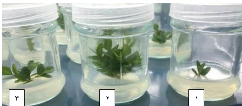
شکل ۳- اثر غلظت‌های مختلف BAP و IBA روی تعداد برگ در گیاهچه‌های شمشاد خزری ( Buxus hyrcana Pojark.) رشد یافته در شرایط درون‌شیشه‌ای. ۱) گیاهچه‌های شاهد، ۲) گیاهچه‌های تیمار شده با ۱ میلی‌گرم در لیتر BAP همراه با ۱/۵ میلی‌گرم در لیتر IBA و ۳) گیاهچه‌های تیمار شده با ۱ میلی‌گرم در لیتر BAP همراه با ۲ میلی‌گرم در لیتر IBA.