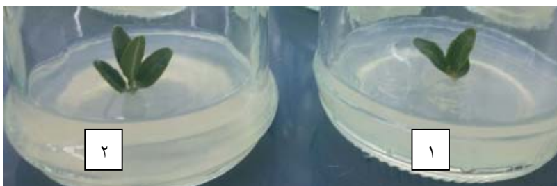
شکل ۲- اثر غلظت‌های مختلف BAP و IBA روی تعداد برگ در گیاهچه‌های شمشاد خزری ( Buxus hyrcana Pojark.) رشد یافته در شرایط درون‌شیشه‌ای در مراحل اولیه‌ی رشد. ۱) ریزنمونه‌ی شاهد و ۲) ریزنمونه‌ی تیمار شده با ۲ میلی‌گرم در لیتر BAP همراه با ۲ میلی‌گرم در لیتر IBA.

گرم در لیتر BAP همراه با ۰/۵ میلی‌گرم در لیتر IBA، ۳) گیاهچه‌های تیمار شده با ۱ میلی‌گرم در لیتر BAP همراه با ۲ میلی‌گرم در لیتر IBA، ۴) گیاهچه‌های تیمار شده با ۱ میلی‌گرم در لیتر BAP همراه با ۱/۵ میلی‌گرم در لیتر IBA و ۵) گیاهچه‌های تیمار شده با ۱ میلی‌گرم در لیتر IBA بدون BAP