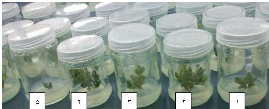
شکل ۱- اثر غلظت‌های مختلف IBA و BAP روی تعداد شاخساره در گیاهچه‌های شمشاد خزری ( Buxus hyrcana Pojark.) رشدیافته در شرایط درون‌شیشه‌ای. (۱) گیاهچه‌های تیمار شده با ۱/۵ میلی‌گرم در لیتر BAP همراه با ۱ میلی‌گرم در لیتر IBA (۲) گیاهچه‌های تیمار شده با ۱ میلی‌گرم در لیتر BAP همراه با ۱ میلی‌گرم در لیتر IBA (۳) گیاهچه‌های تیمار شده با ۱ میلی‌گرم در لیتر BAP همراه با ۱ میلی‌گرم در لیتر IBA (۴) گیاهچه‌های تیمار شده با ۱ میلی‌گرم در لیتر BAP همراه با ۱ میلی‌گرم در لیتر IBA (۵) گیاهچه‌های تیمار شده با ۱ میلی‌گرم در لیتر BAP همراه با ۱ میلی‌گرم در لیتر IBA

در هر ستون میانگین‌هایی که دارای حروف همسان هستند، در سطح احتمال ۵ درصد آزمون چند دامنه‌ای ال.اس.دی تفاوت معنی‌داری ندارند.