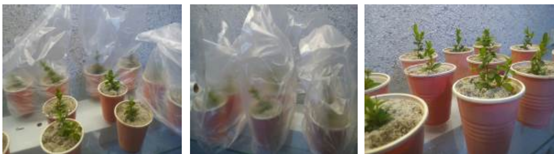
شکل ۶- سازگاری گیاهچه‌های شمشاد خزری ( Buxus hyrcana Pojark.) انتقال یافته از شرایط درون‌شیشه‌ای به شرایط برون‌شیشه‌ای.