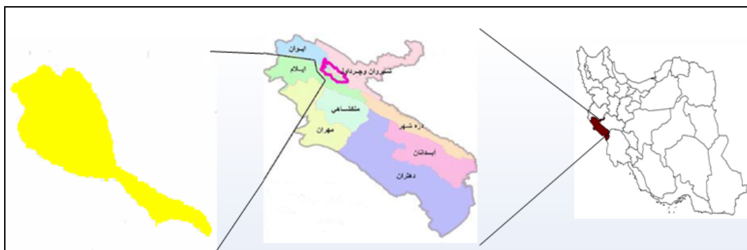
شکل ۲- موقعیت منطقه مورد مطالعه در ایران و استان ایلام

شناخت الگوی پراکنش مکانی گیاهان در تشخیص سازوکارهای خاص آن‌ها، تشریح پایداری اکوسیستم، طراحی طرح‌های مدیریتی مناسب و اقدامات حفاظتی و احیایی مفید است (۲۳ و ۲۷). به‌روشنی این موضوع تأیید شده است، که شناخت الگوی پراکنش مکانی، ابزاری لازم برای مدیریت بهینه در بسیاری از عرصه‌های جنگلی جهان است (۳۵). لذا هدف از انجام این مطالعه، بررسی الگوی پراکنش مکانی گونه‌های شاخص جنگلی در منطقه حفاظت‌شده قزلارنگ به‌عنوان یکی از مهم‌ترین ذخیره‌گاه‌های جنگلی حوزه رویشی زاگرس می‌باشد.