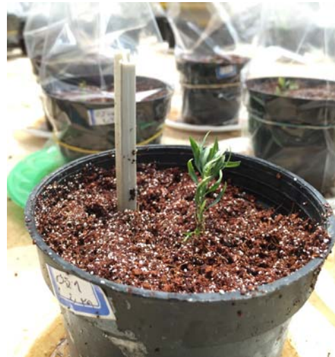
شکل ۴- مرحله استقرار نمونه‌ها در گلدان و در شرایط گلخانه (ژنوتیپ شماره ۱).

لازم بذکر است که در تکثیر رویشی گونه‌های جنگلی از طریق ریزازدیادی همیشه این نگرانی وجود داشته است که تنوع ژنتیکی گونه‌ای که تکثیر می‌شود کاهش یابد و