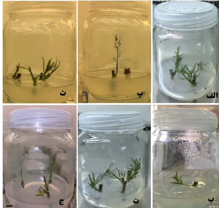
شکل ۱ - کشت سرشاخه‌های سه ژنوتیپ متفاوت بادام کوهی در محیط کشت DKW پس از ۶۰ روز؛ ژنوتیپ ۱: الف و ب، ژنوتیپ ۲: پ و ت، ژنوتیپ ۳: ج و د.

هورمون‌پاشی و ۵ روز پس از هورمون‌پاشی، کمترین تعداد جوانه (به ترتیب ۱/۳ و ۱/۵ عدد) را ایجاد کرد (شکل ۲). ژنوتیپ‌های ۱ و ۲، از نظر تعداد جوانه، میانگین عمومی بیش از ژنوتیپ ۳ داشتند (جدول ۳).